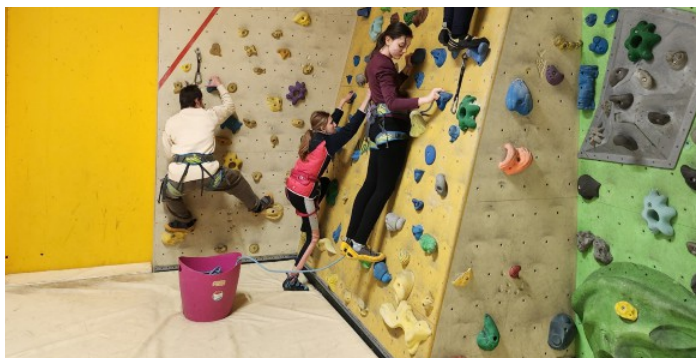
Die Trainingseinheiten für den Kletterbewerb finden in der Kletterakademie Mitterdorf in St. Barbara statt.