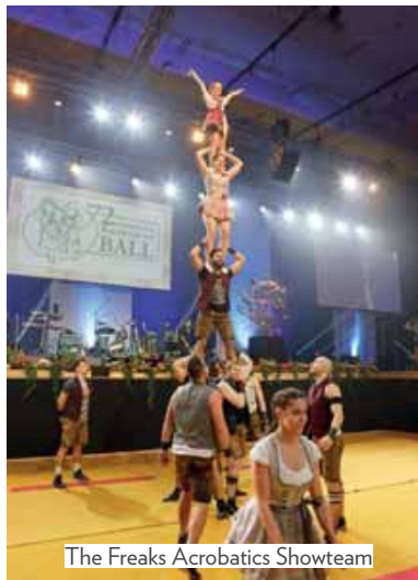
The Freaks Acrobatics Showteam