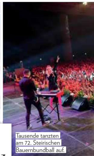
Tausende tanzten am 72. Steirischen Bauernbunball auf.