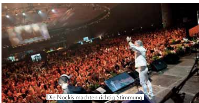
Die Nockis machten richtig Stimmung.