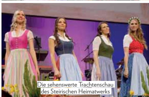
Die sehenswerte Trachtenschau des Steirischen Heimatwerks